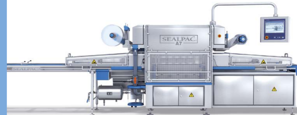
TERMOSELLADORAS DE BANDEJAS de la serie A: tecnología innovadora, máxima productividad, integración sin problemas en líneas existentes de producción.

Alcanzamos una sostenibilidad mayor mediante el ahorro de consumibles. Con nuestras termoselladoras procesamos bandejas ultra ligeras sin perjuicio de la productividad. Con nuestros equipos de termoformado, creamos envases partiendo de films cada vez más finos para distintas aplicaciones gracias a nuestro sistema Rapid Air Forming.