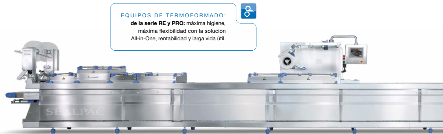
EQUIPOS DE TERMOFORMADO: de la serie RE y PRO: máxima higiene, máxima flexibilidad con la solución All-in-One, rentabilidad y larga vida útil.